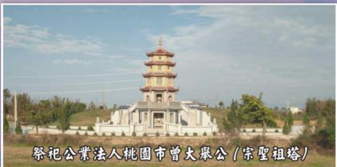
祭祀公業法人桃園市曾大舉公 (宗聖祖塔)