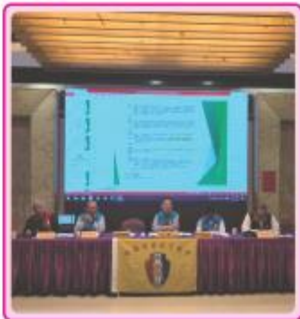
■ 第二十屆第三次理監事聯席會