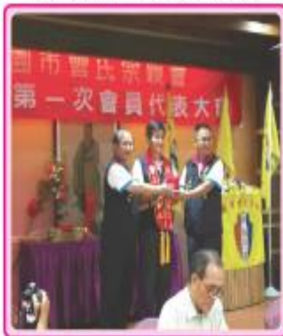
◆ 第20屆新舊任理事長交接典禮