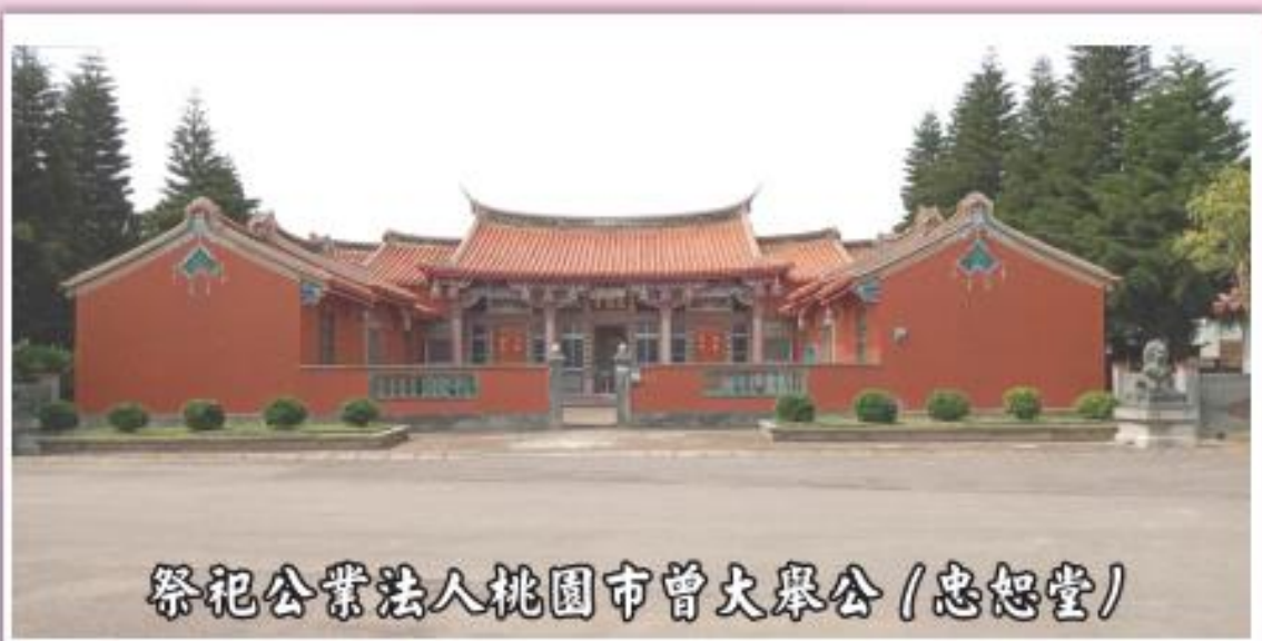
祭祀公業法人桃園市曾大舉公 (忠恕堂)