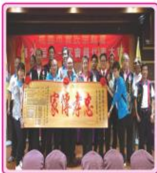
■ 第19屆全體理監事致贈新任榮繼理事長 (志孝傳家)賀匾