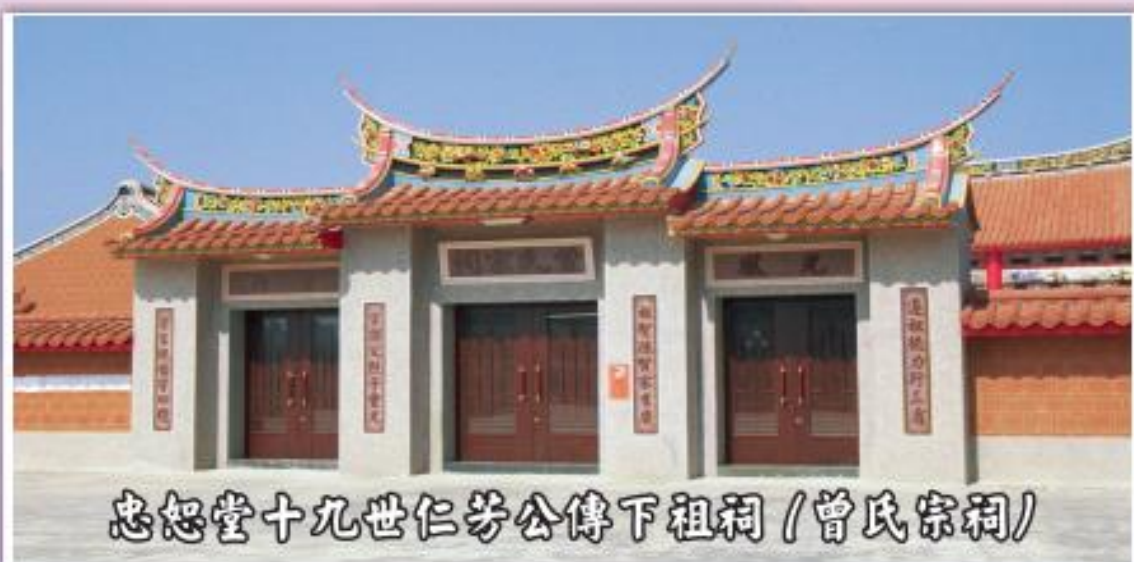
忠恕堂十九世仁芳公傳下祖祠 (曾氏宗祠)