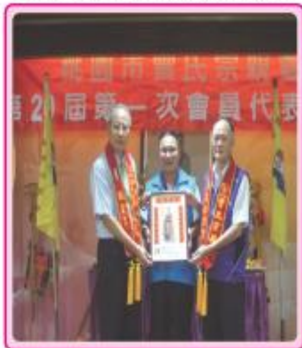
■ 全國理事長聯誼會頒孝道傳家賀匾