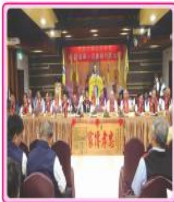
◆ 大會貴賓與會盛況